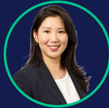
Dajin Lie Salary Partner